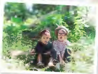
※講師撮影写真(写真はイメージです。スマホで撮影した写真ではありません。)

1人に1台スマホを持つ時代になり、昔よりも写真を撮ることが手軽で身近になりましたね。この講座ではお手持ちのスマホで誰でもプロのような「オシャレな」写真を撮るコツを学びます。ちょっとしたポイントを学び、家族旅行、ペット、お子様の運動会の写真、また趣味のSNSに投稿する写真の撮影などに活かしてみませんか？