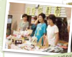
手づくり市は復興支援を目的として開催されました