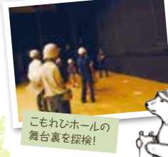
こもれびホールは舞台裏を探索!