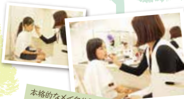
本格的なメイク体験はモデルさんみたいでドキドキ!