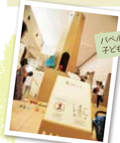
ハバエタワーは子ども達に大人気!

マルシェもワークショップも演劇も楽しめる、もり多くのイベントが開催されました。たくさんのご来場ありがとうございました!