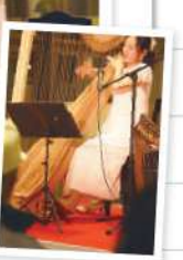
グランドハーブだけでなく、ノンペダルハーブ、ミニハーブの紹介も。