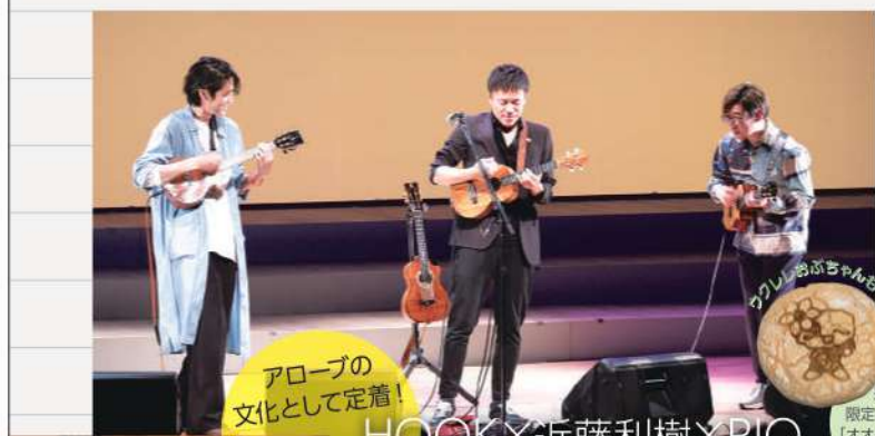
アローブの文化として定着!