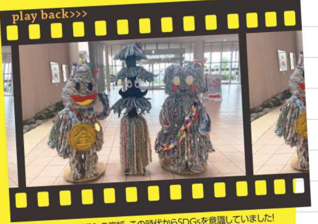
折り鶴を作る紙はチラシの裏紙。この時代からSDGsを意識していました!

2016年3月、大府市の人口が9万人を超えたことを記念して来館者の皆さんに9万羽の折り鶴を作ってもらおう企画が始まりました。毎月のグランプリを発表するなど企画は予想以上に盛り上がり、わずか9ヶ月で達成!「生きがいに変わった」「孫との会話が生まれた」など嬉しい反響もいただきました。そして皆さんが作ってくれた9万羽の折り鶴で、おぶちゃんをはじめ大府市ゆかりのキャラクターの折鶴オブジェが完成したのです。