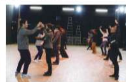
2月に行ったキックオフ講座では、初対面同士の相手でも打ち解けられるアイスブレイクを中心に、和気あいあいと盛り上がりました。