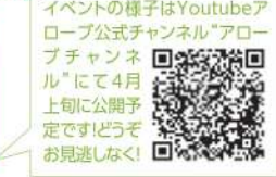
イベントの様子はYoutubeアローブ公式チャンネル「アローブチャンネル」にて4月上旬に公開予定です!どうぞお見逃しなく!