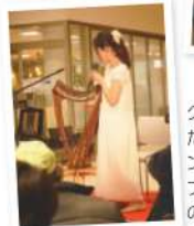
コンサート前に設けられた体験コーナーは、長い行列ができるほどの人気!子ども達が興味津々でミニハーブに触れていました。