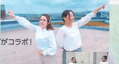
手話ソングの課題曲はAKB48の「365日の紙飛行機」です!

聞こえない人への理解を深め、あいさつ等の日常会話や手話ソングを学ぶ、全6回の講座を開催中。講座内で学んだ手話ソングは、「HANDSIGN LIVE」の前座の舞台上で披露します!