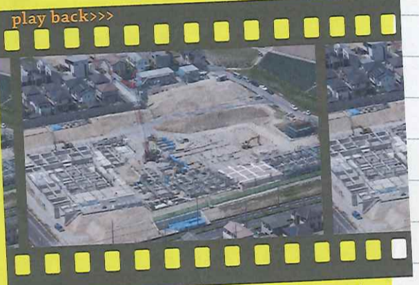
2013年4月、建物の基礎工事が進んでいます。空から見ると、アローブの敷地の広さを実感できますね。

今から15年前の2008年3月、文化交流のシンボル施設として、大型ホール、図書館を兼ね備えた複合施設建設の構想が始まりました。「allobu」の名称は、大府市生涯学習プラン2007の「共に生きあおう大府のまちで」という言葉から、全ての人、全てのもの、全ての大府と言う思いが込められています。当時を知るスタッフによると、アローブの建設地はまだ何も無い更地で「図書館ができるらしい!?!」と噂になっていたそう。