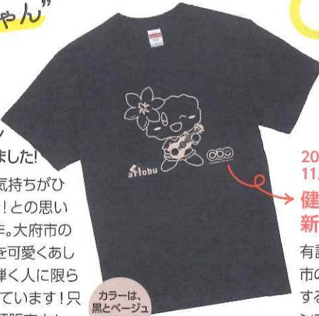
カラーは、黒とベージュの2色展開!

大府市とアローブがコラボして、昨年爆誕した“ウクレレおぶちゃん”のTシャツを作りました!ウクレレを演奏する時に皆の気持ちがひとつになるグッズを作りたい!との思いからスタートしたTシャツ制作。大府市の人気キャラクターおぶちゃんを可愛くあしらったTシャツはウクレレを弾く人に限らずたくさんの方にご愛用頂いています!只今、アローブ総合案内にて、好評販売中!