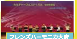
フレンズハーモニカ大府