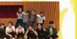
PDCパインダンスサークル