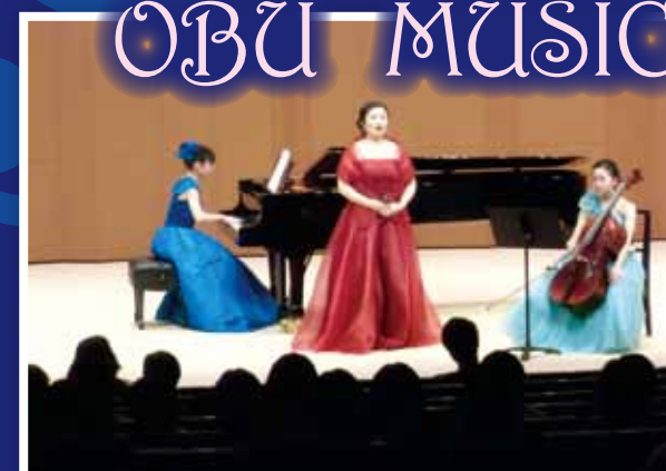
大府出身者でアンサンブル演奏、練習時間のない中“アベマリア”のハーモニーは素晴しかったです。