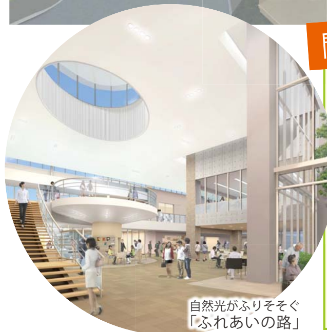
自然光がふりそそぐ「ふれあいの路」